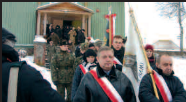
Poczty sztandarowe w zimowej scenarii w roku ubiegłym