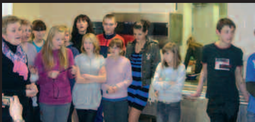
Grupa dzieci z Podbrodzia