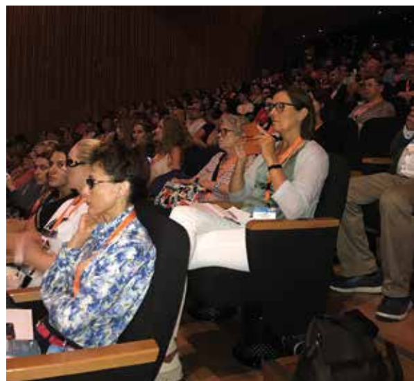
Rycina 10. Sala obrad