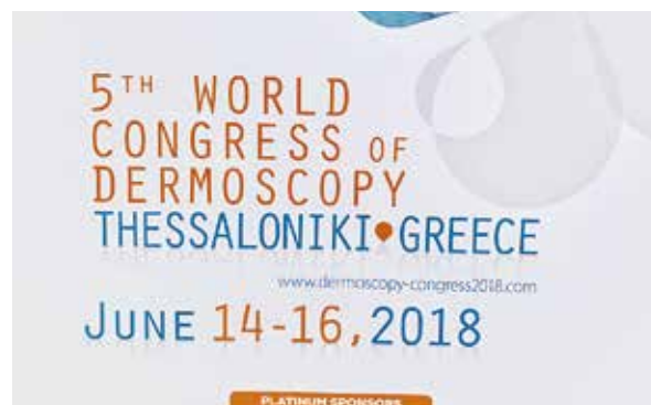
Rycina 2. Plakat konferencji