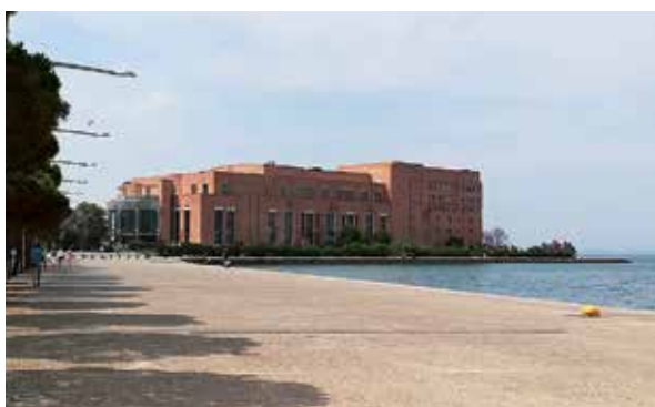
Rycina 1. Centrum konferencyjne