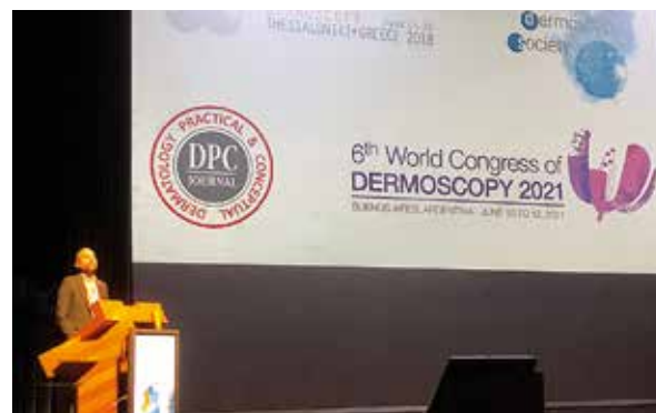
Rycina 2. Profesor Aimillios Lallas