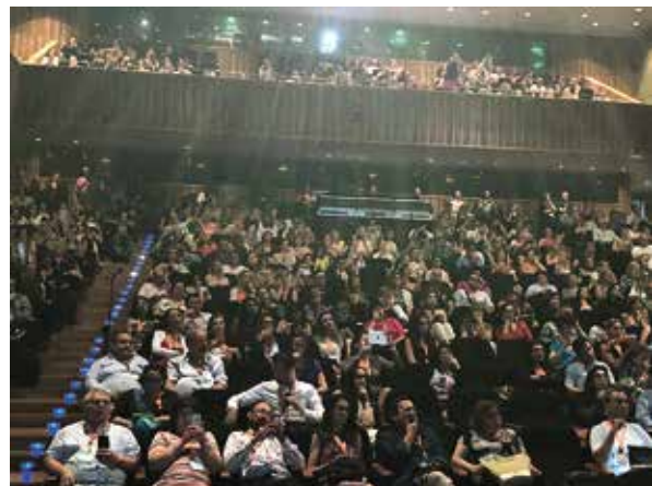
Rycina 8. Sala obrad