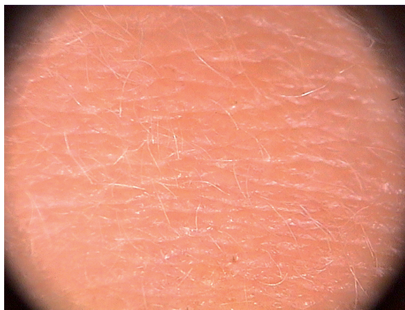
Figure 3. Trichoscopy performed 6 weeks after treatment initiation in a non-responder with the presence of non-pigmented vellus hairs Rycina 3. Badanie trichoskopowe wykonane po 6 tygodniach od rozpoczęcia terapii u pacjenta nieodpowiadającego na leczenie. Widoczne bezbarwnikowe włosy meszkowe

12/17 (71%) responders and in 17/18 (94%) non-responders yellow dots were detected. Black dots, broken hairs, exclamation mark hairs and tapered hairs were detected in 5/17 (29%), 5/17 (29%), 1/17 (6%) and 0/17 (0%) responders, respectively, and in 7/18 (39%), 6/18 (33%), 1/18 (6%) and 1/18 (6%) non responders, respectively. Pohl-Pinkus constrictions were not observed in follow-up trichoscopy in both responder and non-responder groups.