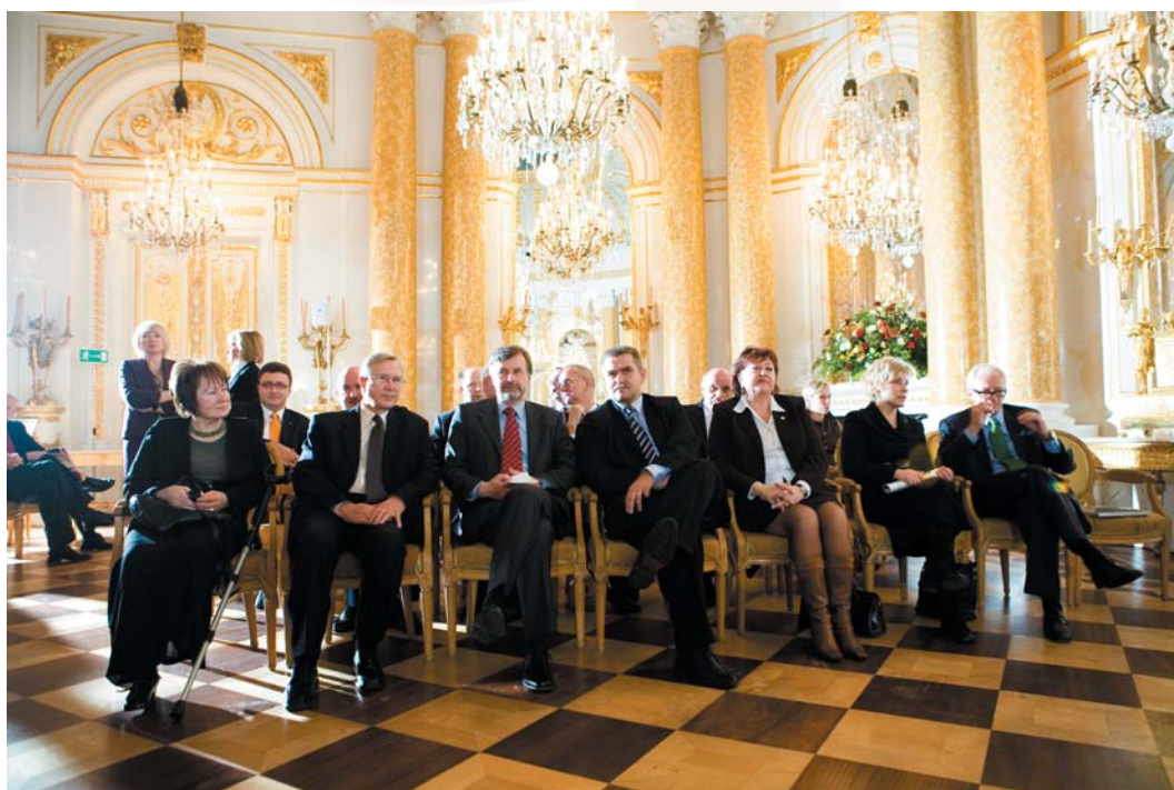
Fot. 1 W pierwszym rzędzie w Sali Wielkiej Zamku Królewskiego zasiedli członkowie Kapituły, która wybrała tegorocznych zwycięzców