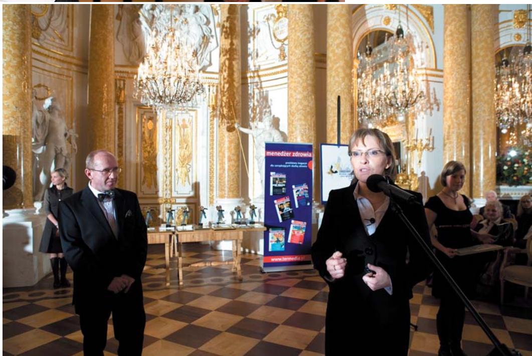
Fot. 4 Ewa Kopacz o Człowieku Roku 2007 w Ochronie Zdrowia: – Profesor Skarżyński to człowiek, który nie liczy czasu poświęcanego pacjentom