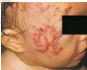
po 12 tygodniowej terapii Kelo-cote®